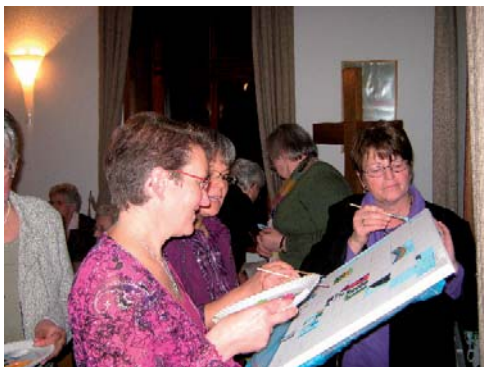
Eine Art Puzzlespiel: Malen nach Vorlage. Auf dem Blatt waren nummerierte Quadrate. Wer mochte, konnte sich eines von ca. 40 nummerierten Teilen eines Bildes holen, und es auf den korrekten Platz auf dem Blatt abmalen, damit zum Schluß das ganze Bild zu sehen war.

Allen unseren Mitarbeitenden noch einmal ein herzliches „Dankeschön“ für die wertvolle Mitarbeit in der Kirchengemeinde!