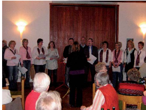
Der Chor Kontrastprogramm.

Dazu ein kurzer Bericht. Und auf den Bildern gibt es dann ganz viele „Gesichter der Gemeinde“ zu entdecken.