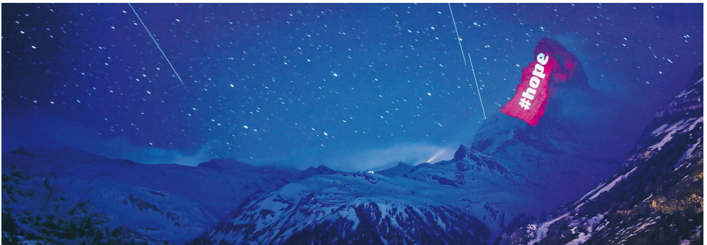
(Lichtinstallation auf das Matterhorn aus dem Frühjahr 2020)